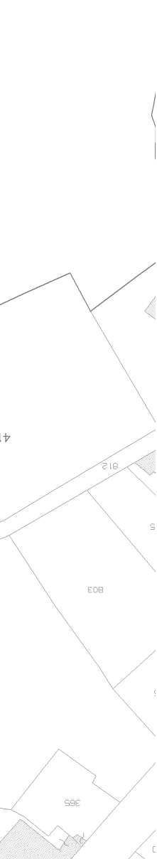
ESTRATTO CATASTALE Rapp. 1:1000